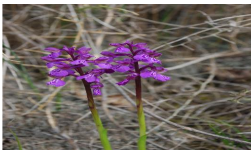
Orchidea delle Dune Cephanthera longifolia