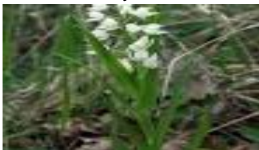
Orchidea delle Dune Anacamptis Piramidalis