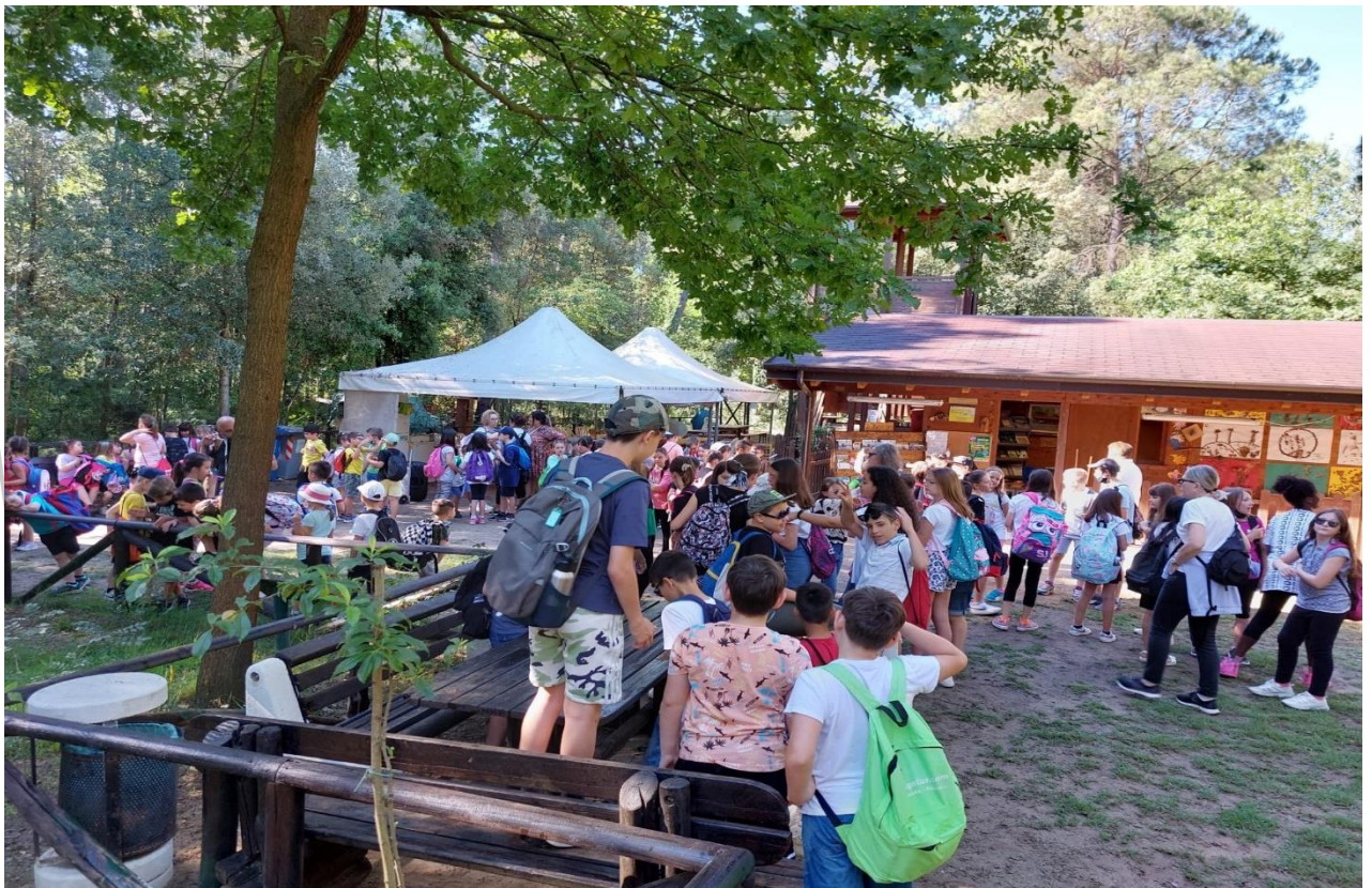
Parco delle dune fossili di Porto Viro