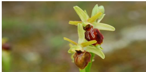
Orchidea delle Dune: Orchiins Moiro