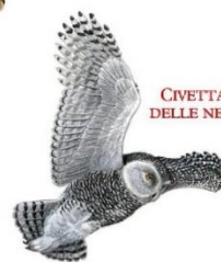
CIVETTA DELLE NEVI