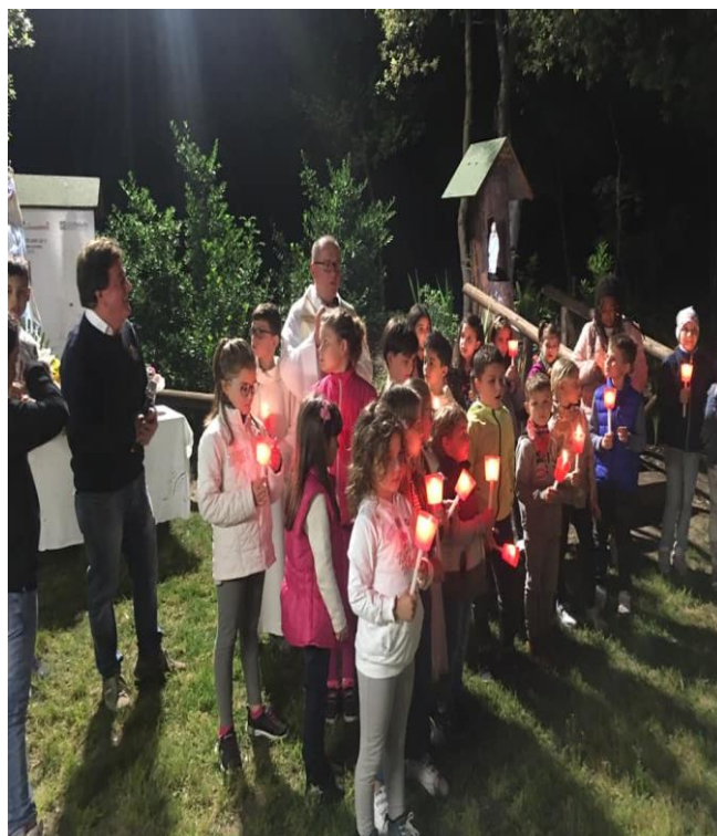
Madonna delle Dune